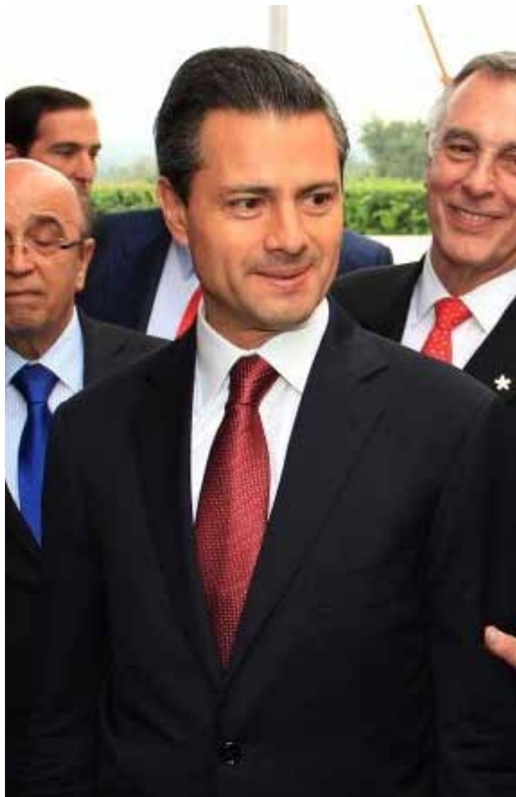
Enrique Peña Nieto

En el presupuesto del Centro de Capacitación Cinematográfica A.C., se solicitó a la cámara reducir su gasto de 75.67 millones de pesos a 42.98 millones (43.20 por ciento menos); al de Estudios Churubusco Azteca, de 128.39 millones a 79.26 (38.27 por ciento menos); al de Educal, de 64.60 a 54.63 millones (una merma de 15.43 por ciento), y al Centro Cultural y Turístico de Tijuana, de 109.68 a 93.9 millones de pesos (menos 15.12 por ciento).