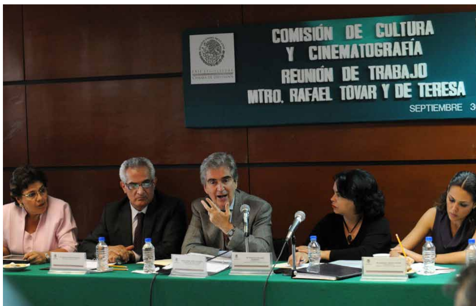
Rafael Tovar y de Teresa con la Comisión de Cultura de la Cámara de Diputados

No obstante, Rafael Tovar y de Teresa apuntó que si bien estas iniciativas se siguen manteniendo, hoy es necesario reconocer la nueva realidad y los nuevos actores que actualmente se encuentran en juego a nivel social. “En primer lugar nuestra prioridad es dar a la cultura una verdadera dimensión social que se concentre